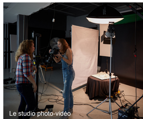
Le studio photo-vidéo

de disposer des équipements numériques à la pointe de la technologie. Par exemple des machines virtuelles accessibles à distance et dotées d'une accélération graphique (GPU) ; d'imprimantes à plat pour réaliser les maquettes ou encore d'outils de streaming pour les cours magistraux.