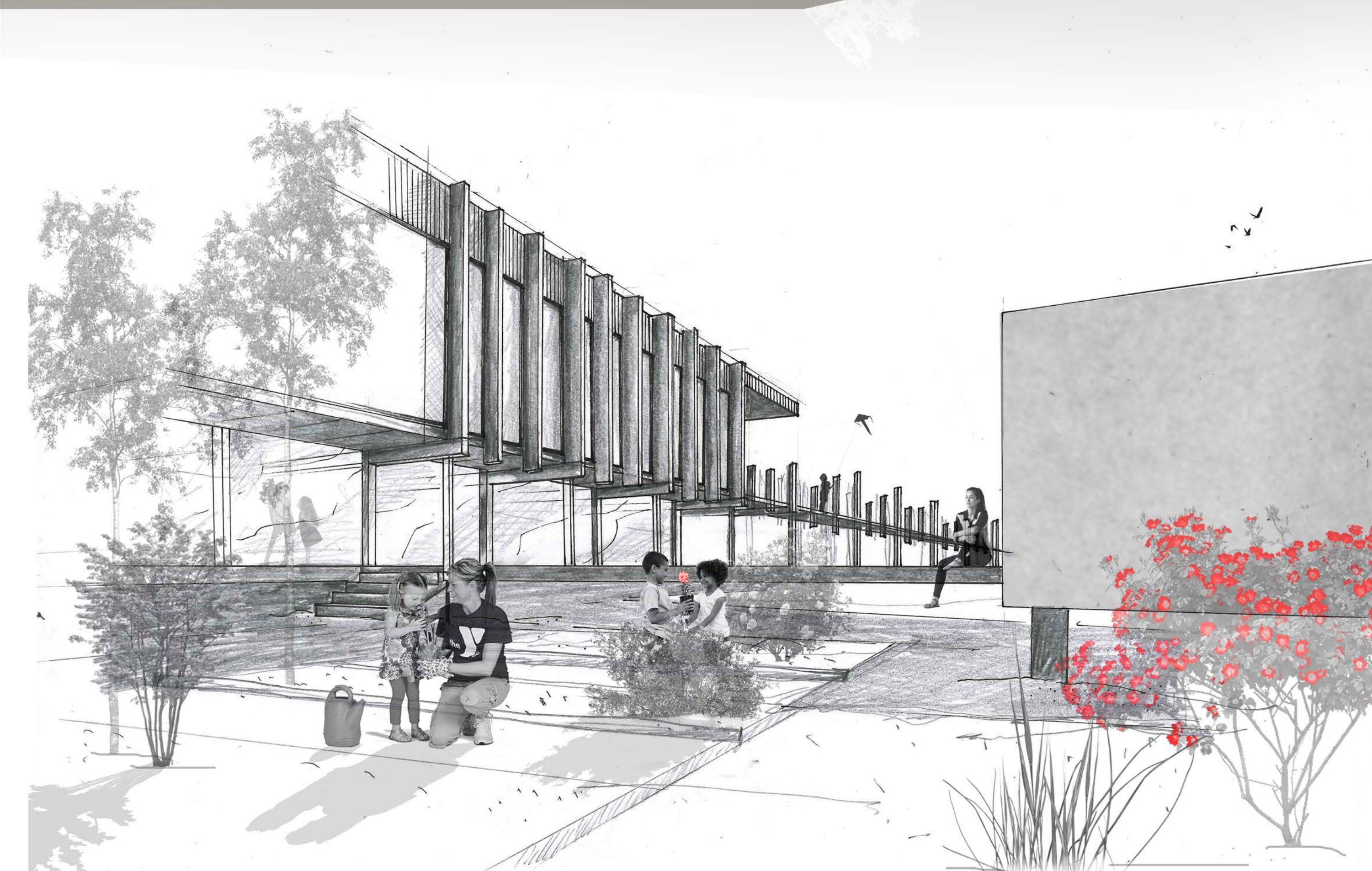
Jardin des senteurs