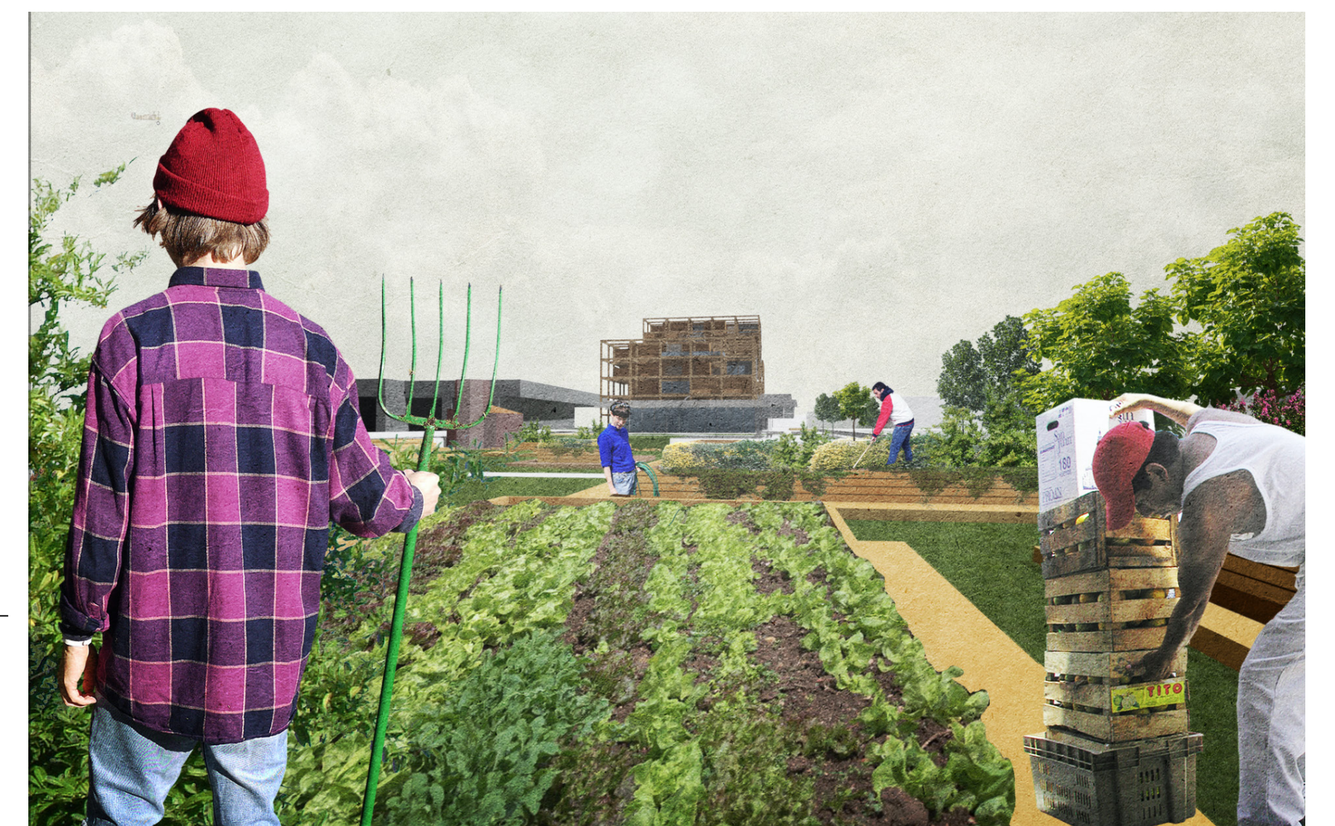
Les jardins partagés comme dynamique de quartier