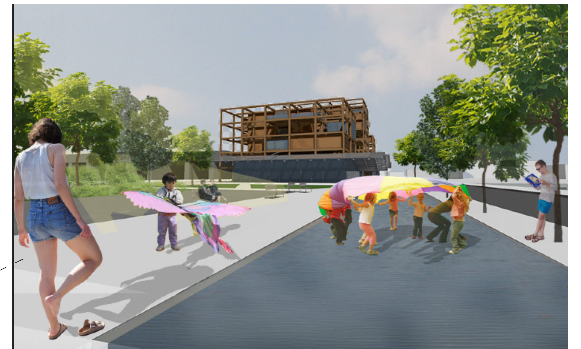
Vue depuis le parcours - le miroir d'eau