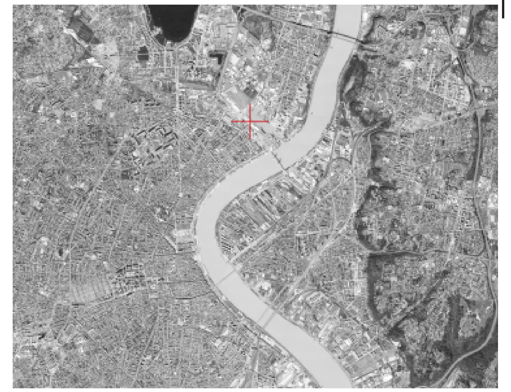
Situation des bassins à flot dans Bordeaux