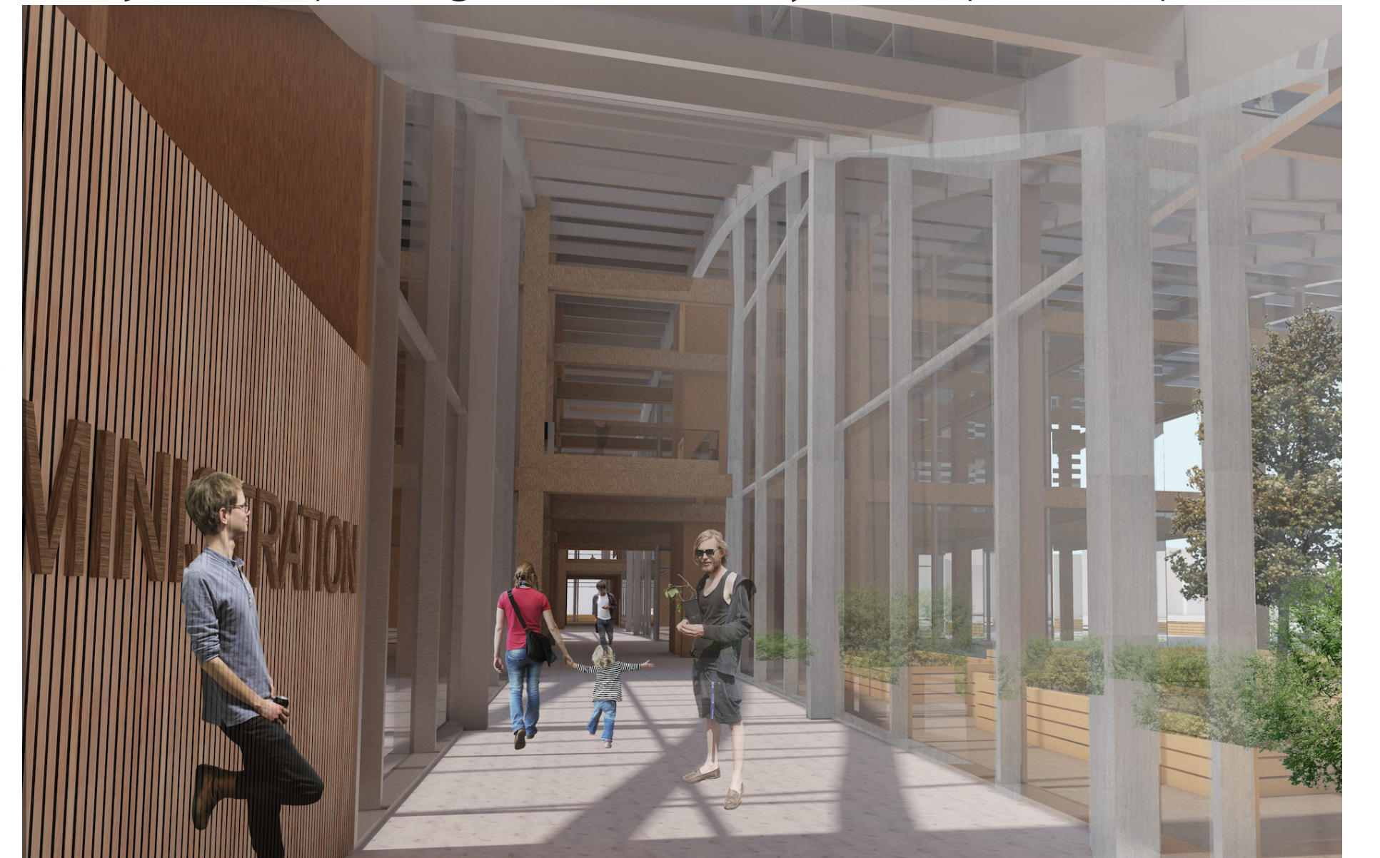
Entre serres et éducation