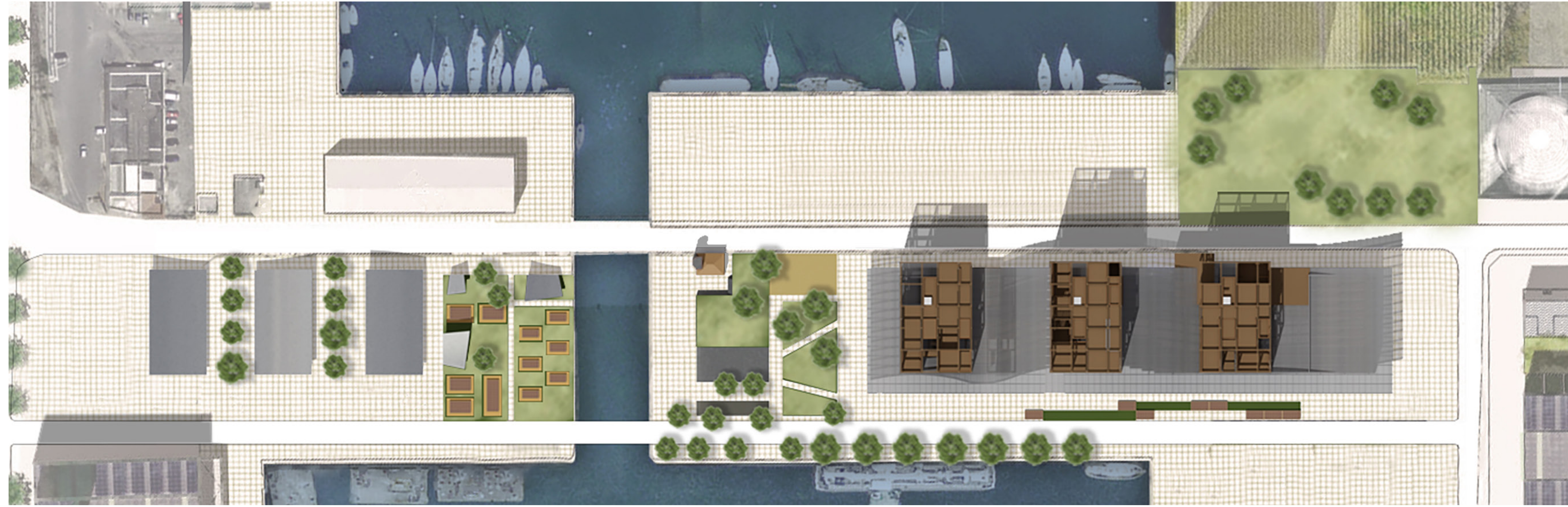
PLAN MASSE 1/1000