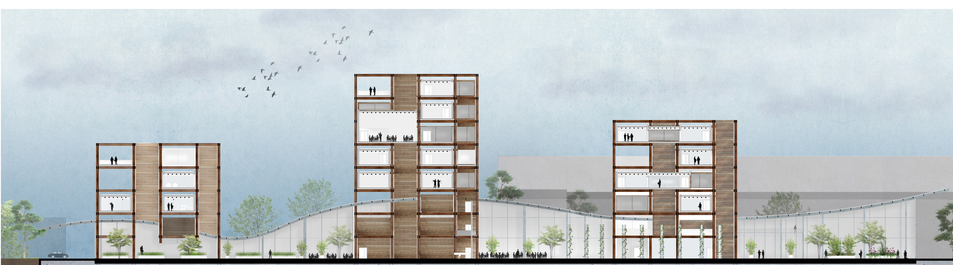
PLAN DE RDC / COUPE 1/500