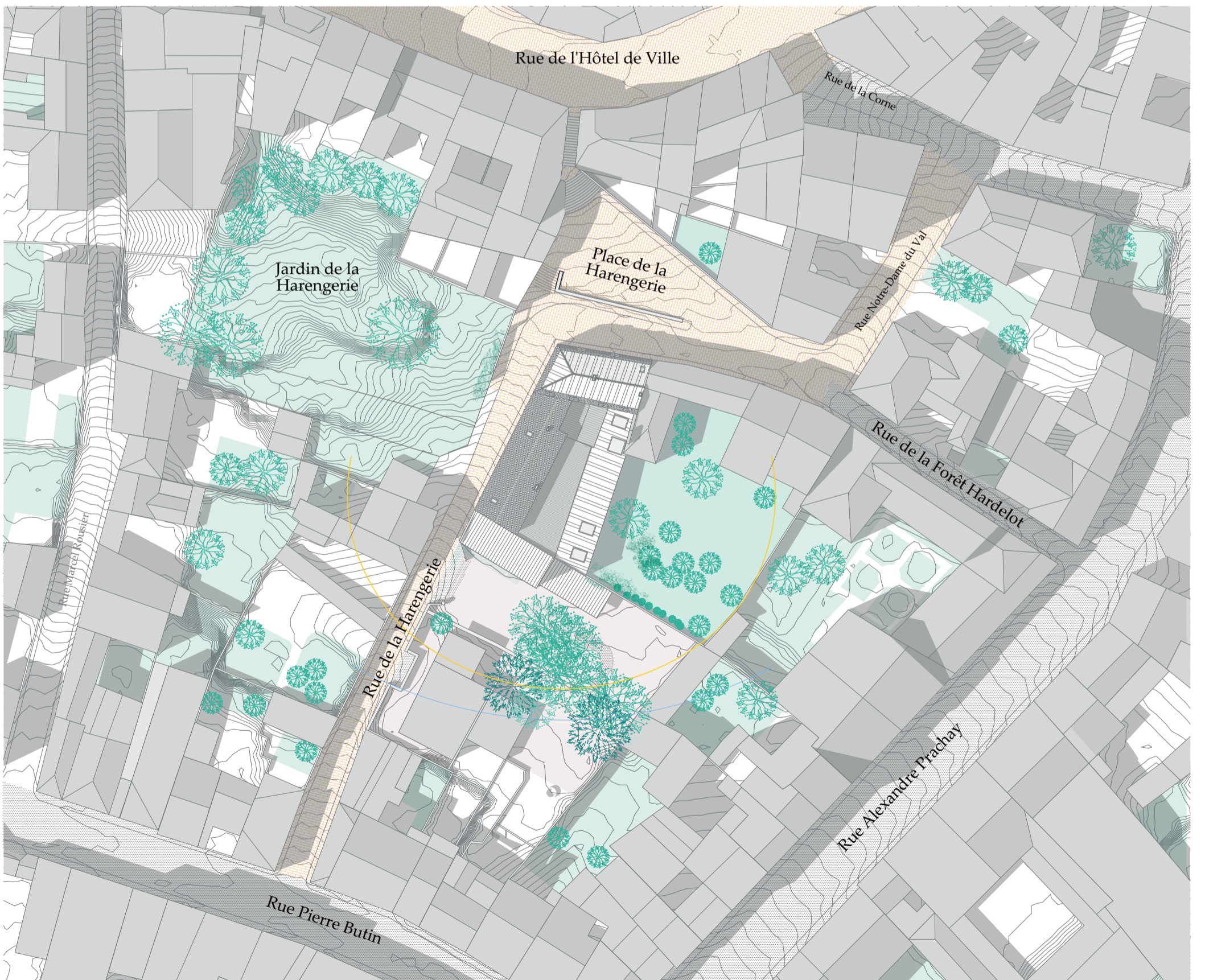
Quadrilatère de la Harengerie, entre urbain et jardin : un bâtiment délaissé aux multiples facettes Plan masse ombré existant avec lignes de niveau tous les 20cm et héliodons