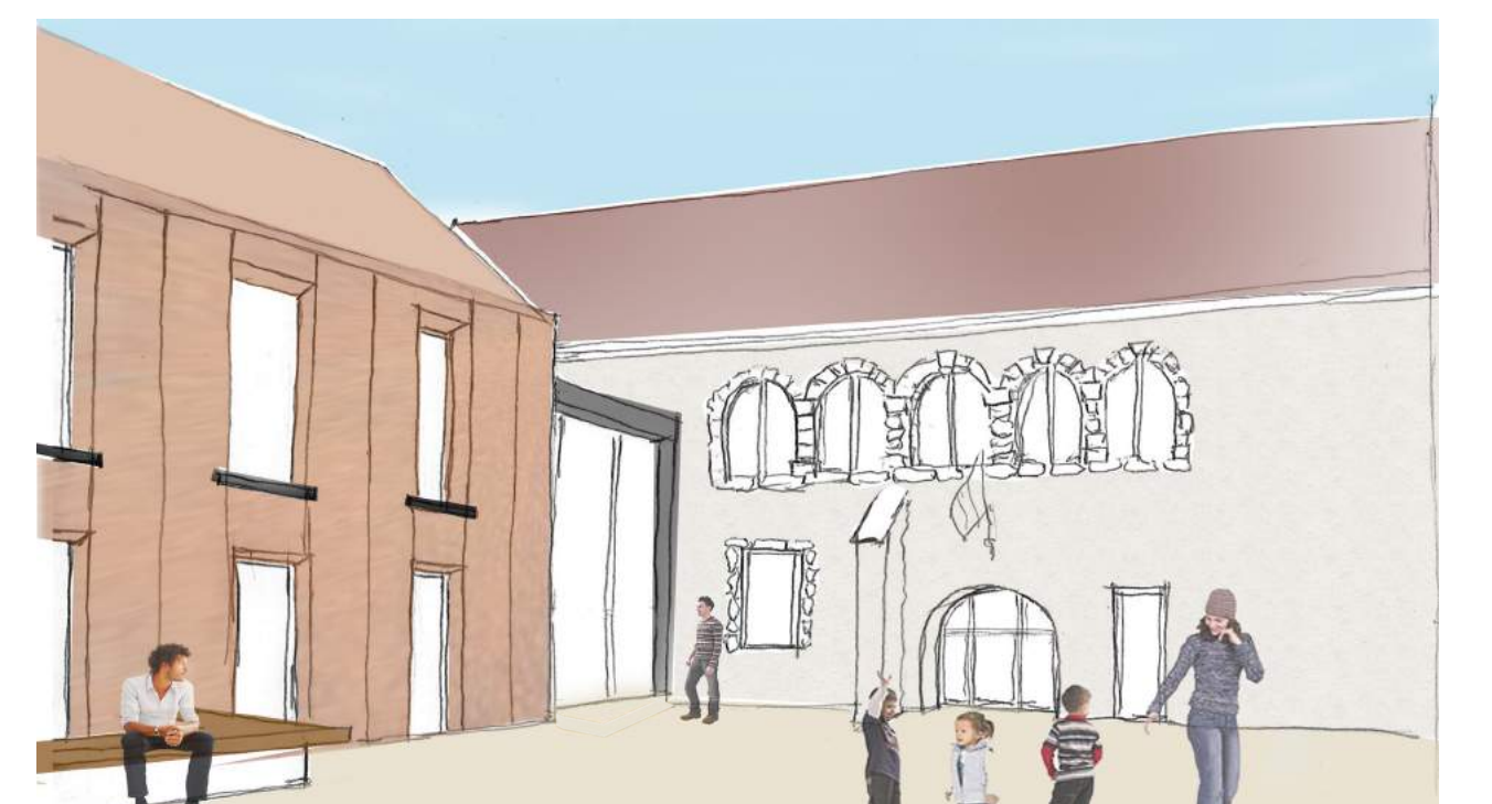
Vue depuis l'espace public vers l'entrée de la Mairie