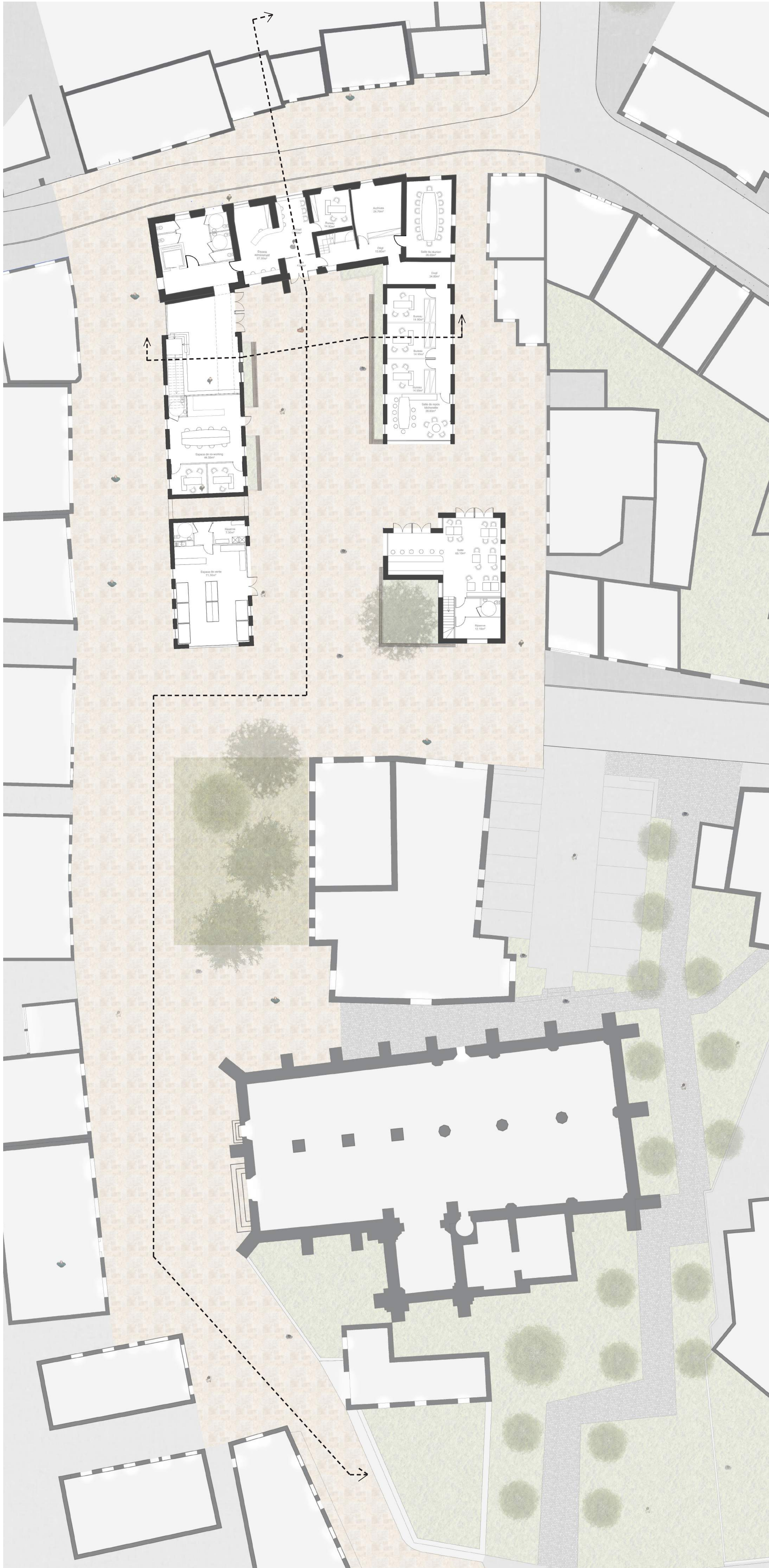
N PLAN DU REZ-DE-CHAUSÉE Echelle : 1/200e

Steven AUBOIS // DE 6 : TRANSFORMATIONS - 20 Février 2020 Vesselina LETCHOVA CARCELERO - Olivier PERRIER