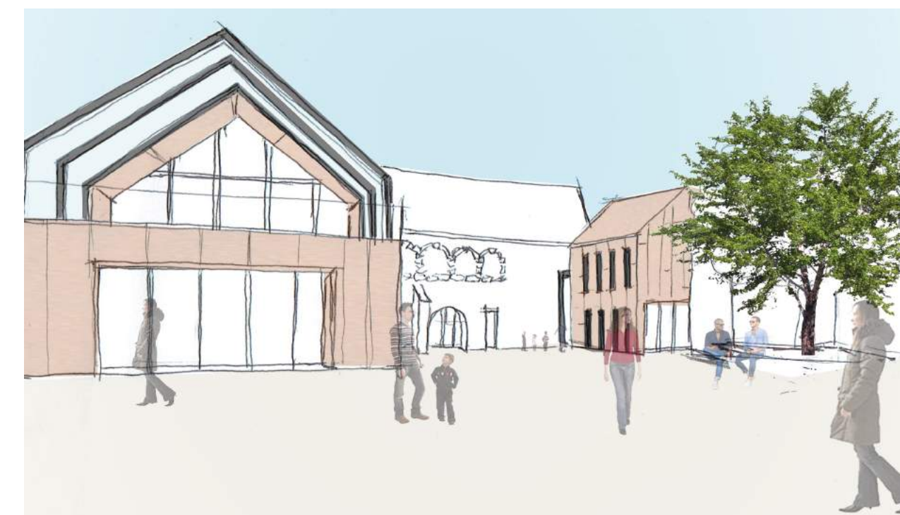
Vue sur le Parvis de la Mairie