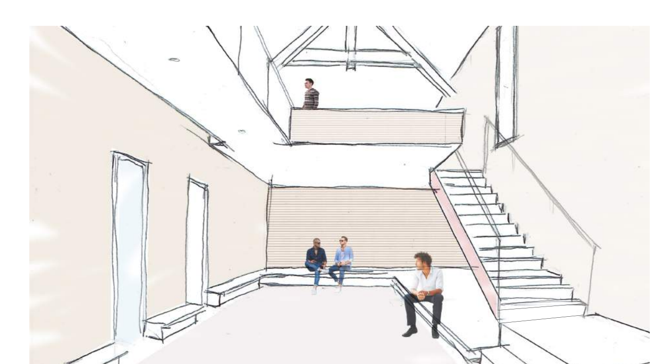
Vue depuis le foyer de la Mairie