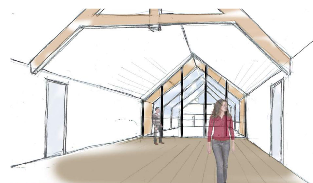
Vue depuis la salle des mariages vers l'Eglise