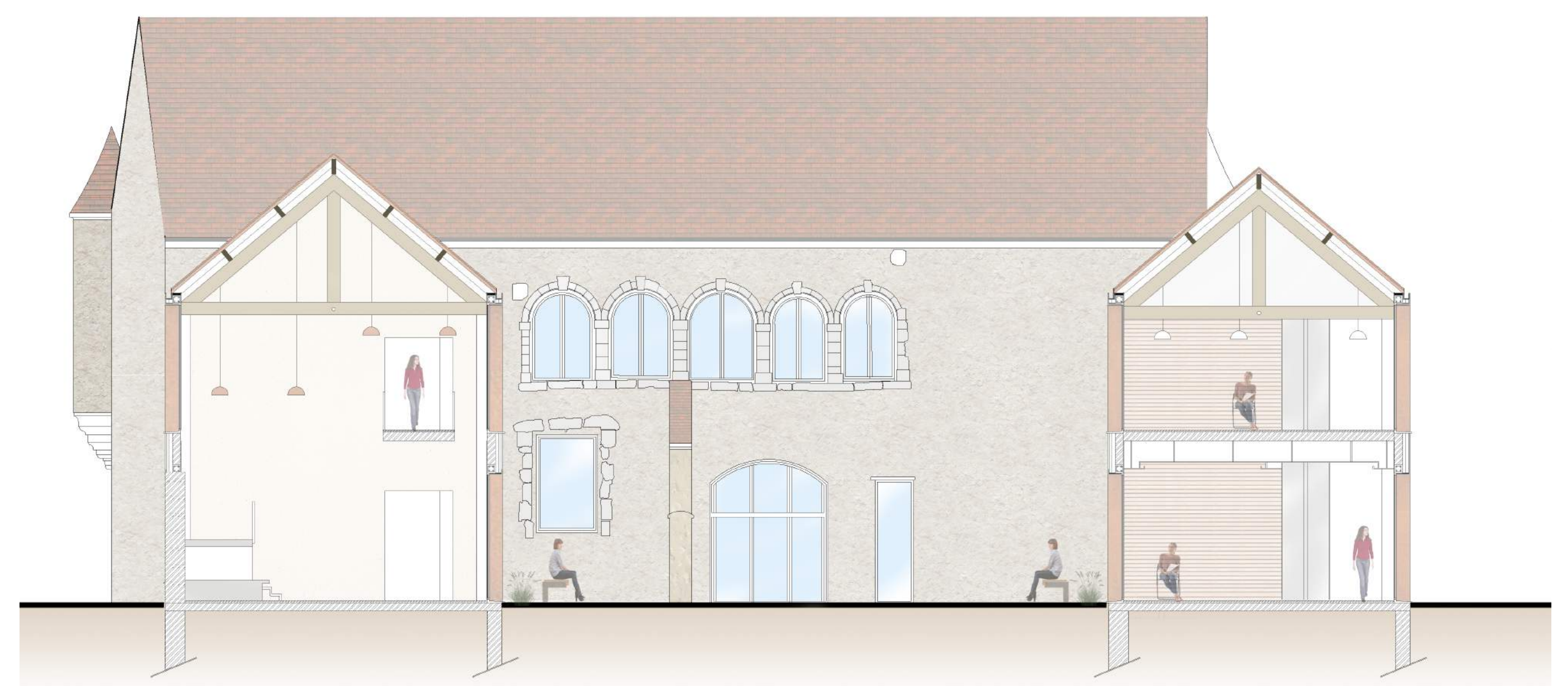
COUPE TRANSVERSALE Echelle : 1/100e