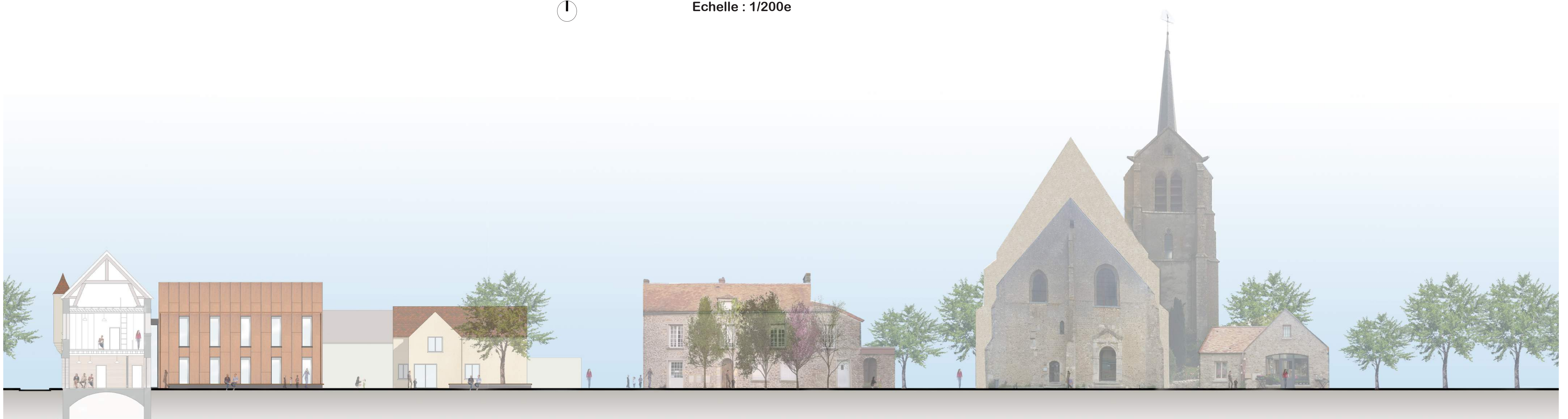
COUPE PAYSAGERE Echelle : 1/200e