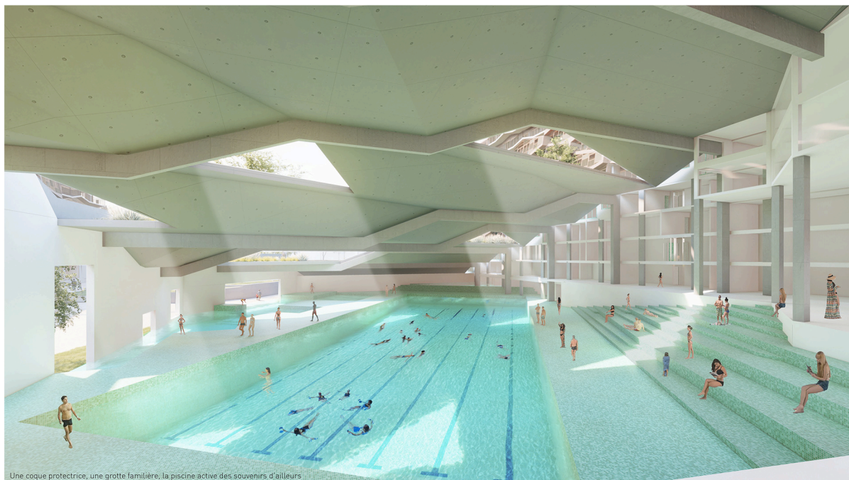
Une coque protectrice, une grotte lamellaire, la piscine active des souvenirs d'ailleurs