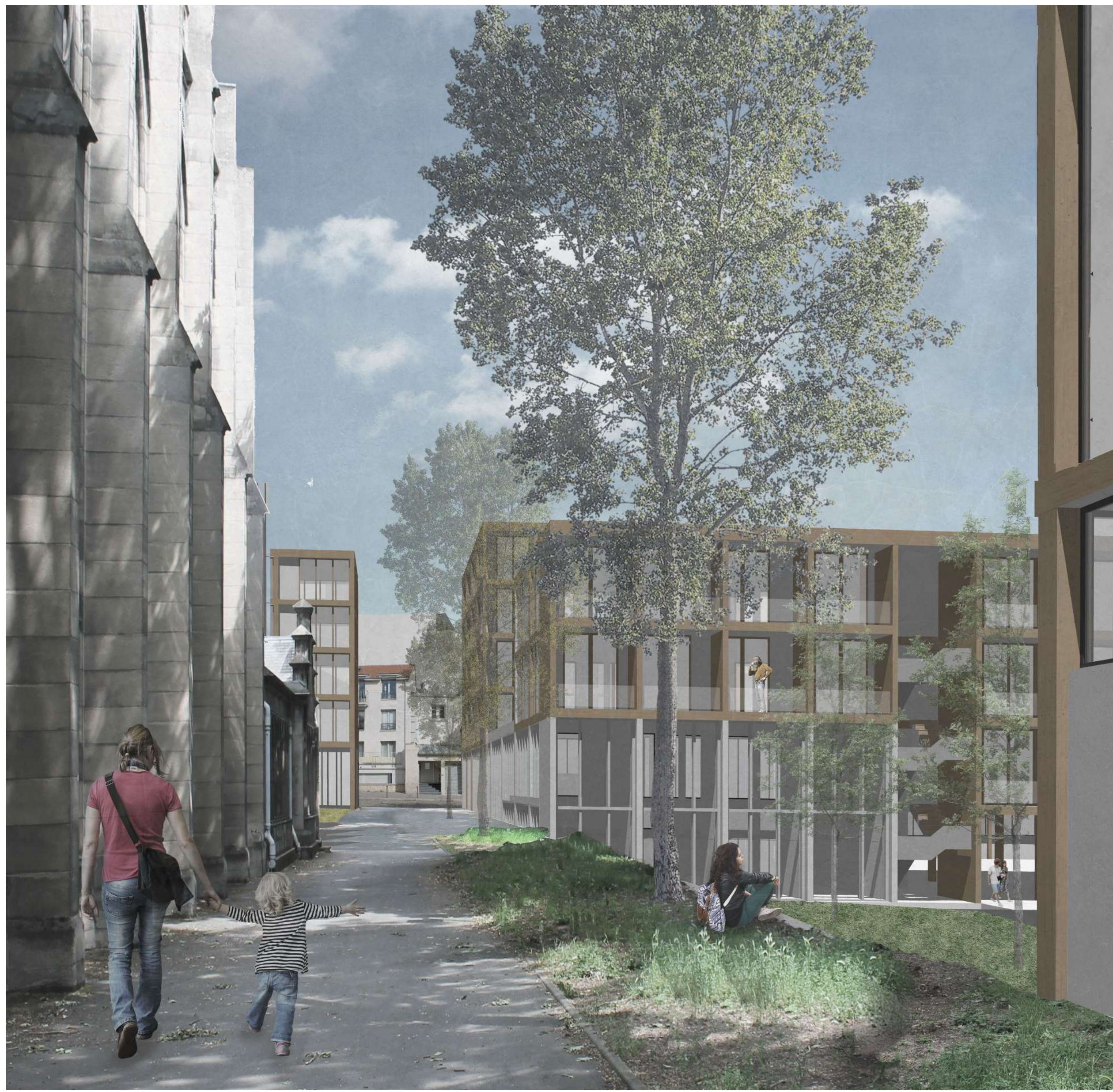
VUE DE L'ENTRÉE DU CONSERVATOIRE - passage sous l'immeuble avenue Reille