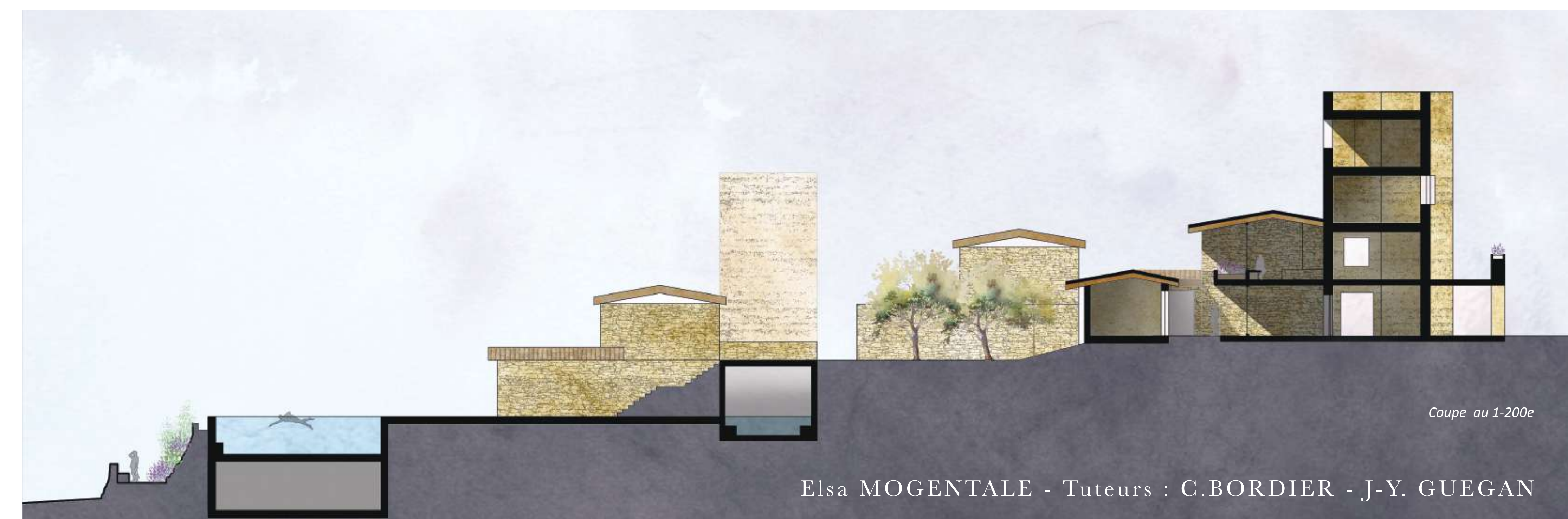
Coupe au 1-200e