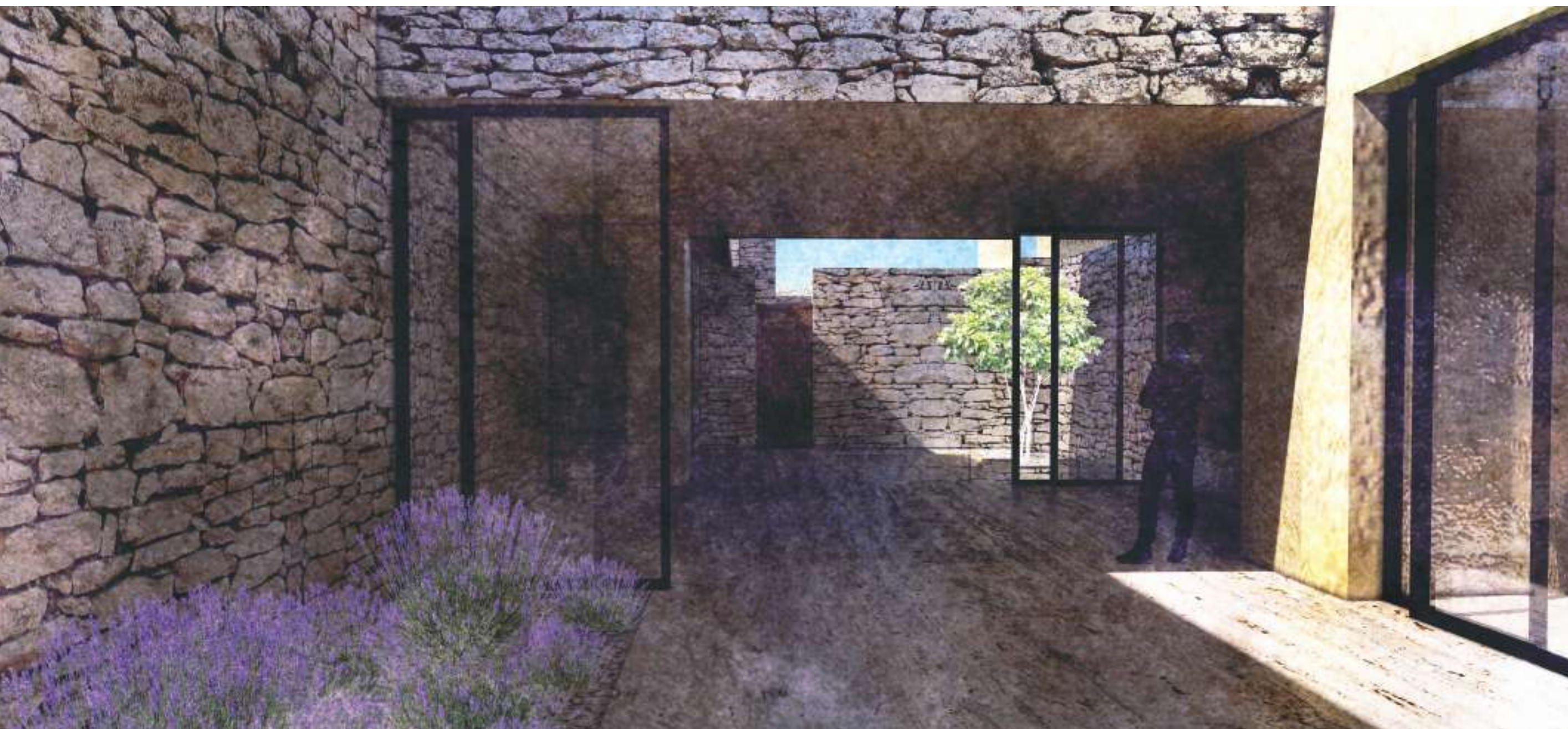
Perspective - Vue vers l'intérieur d'un logement depuis un premier patio - Création d'un effet de profondeur