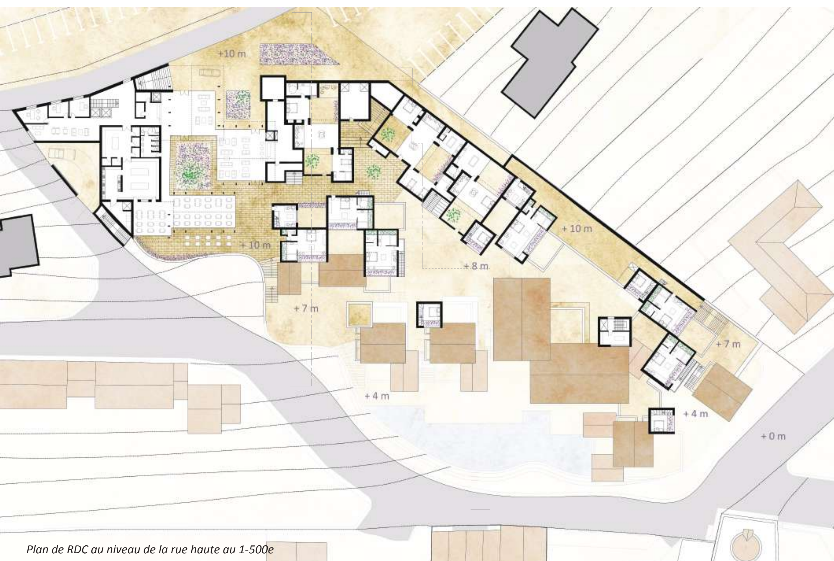
Plan de RDC au niveau de la rue haute au 1-500e