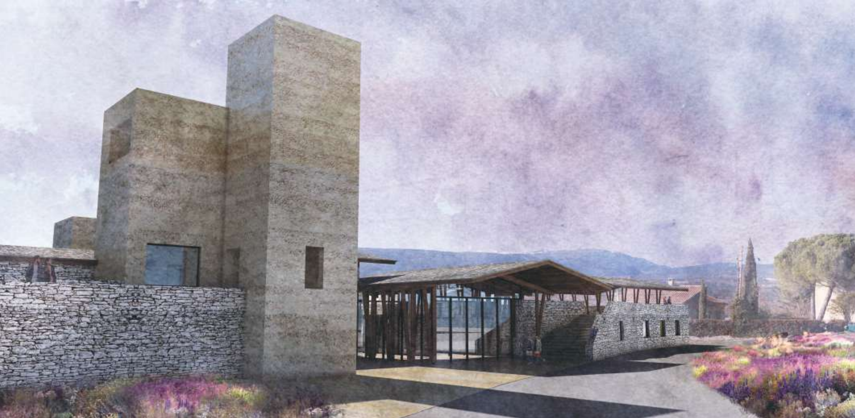
Perspective - Vue de l'entrée de l'Hotel-Spa