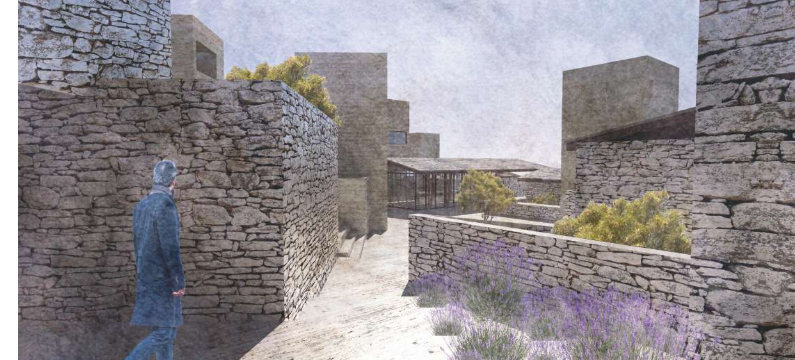
Perspective - Vue depuis les ruelles intérieures