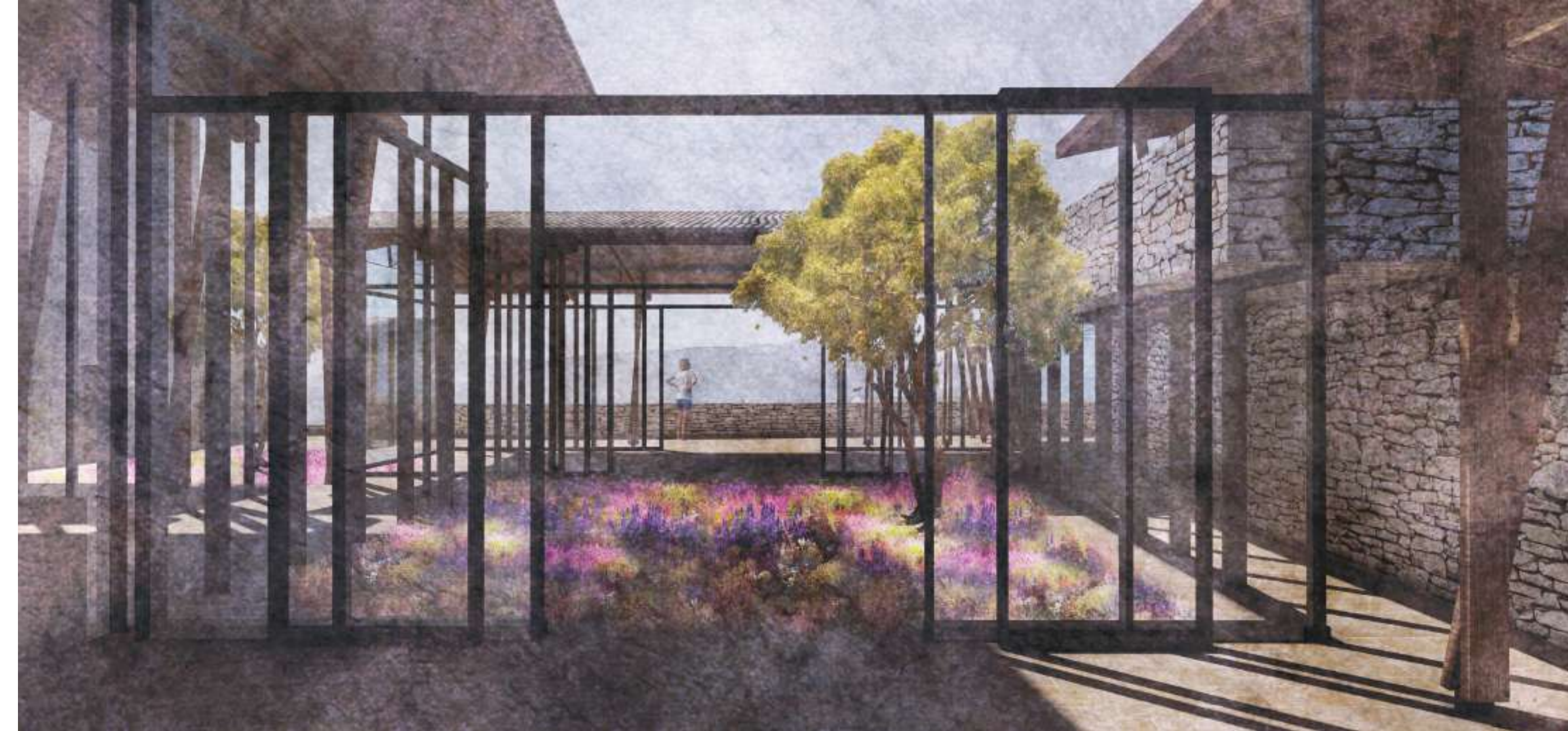
Perspective - Vue depuis le hall d'entrée vers le jardin et de paysage au loin