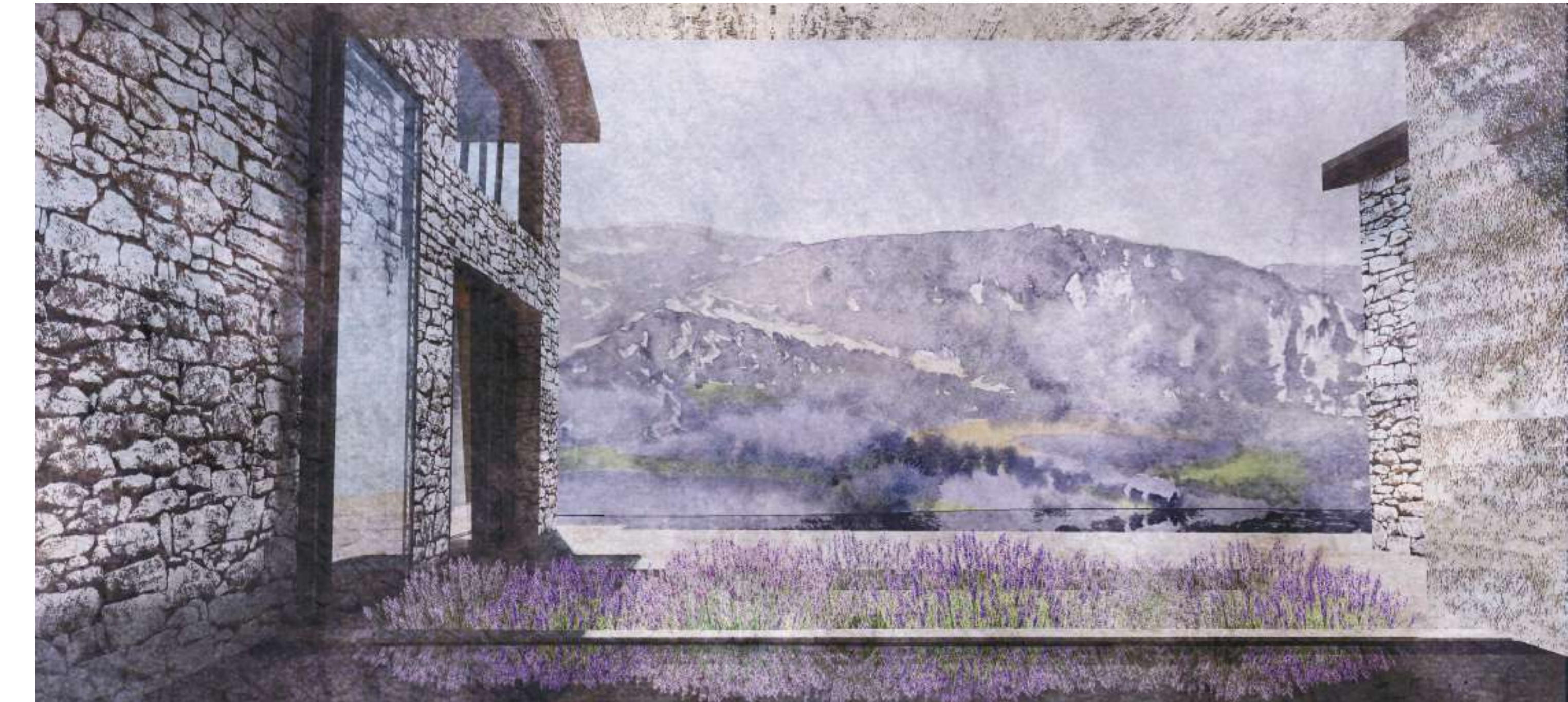
Perspective - Vue depuis les bains vers le paysage de la vallée de la Nesques

Ce projet est situé dans un village de moyenne montagne implanté sur un éperon rocheux d'où il domine la vallée de la Nesque et ces paysages de champs de lavandes. Il est constitué d'un espace hôtellerie-spa et d'un espace pédagogique. Ce dernier prend la forme d'une promenade le long de la parcelle ce qui permet de connecter ce site aux ballades touristiques du village, tout en servant de « vitrine », séduisant les passants et les attirant vers l'hôtel et son spa. Son architecture prend la forme d'un cheminement à travers l'imaginaire du moyen-âge. L'architecture traditionnelle est réinterprétée de manière contemporaine en jouant sur l'ambiguïté des formes et des matériaux. Une grande importance est donnée aux espaces de déambulations, à la relation au paysage et à la création de jeux de profondeur.