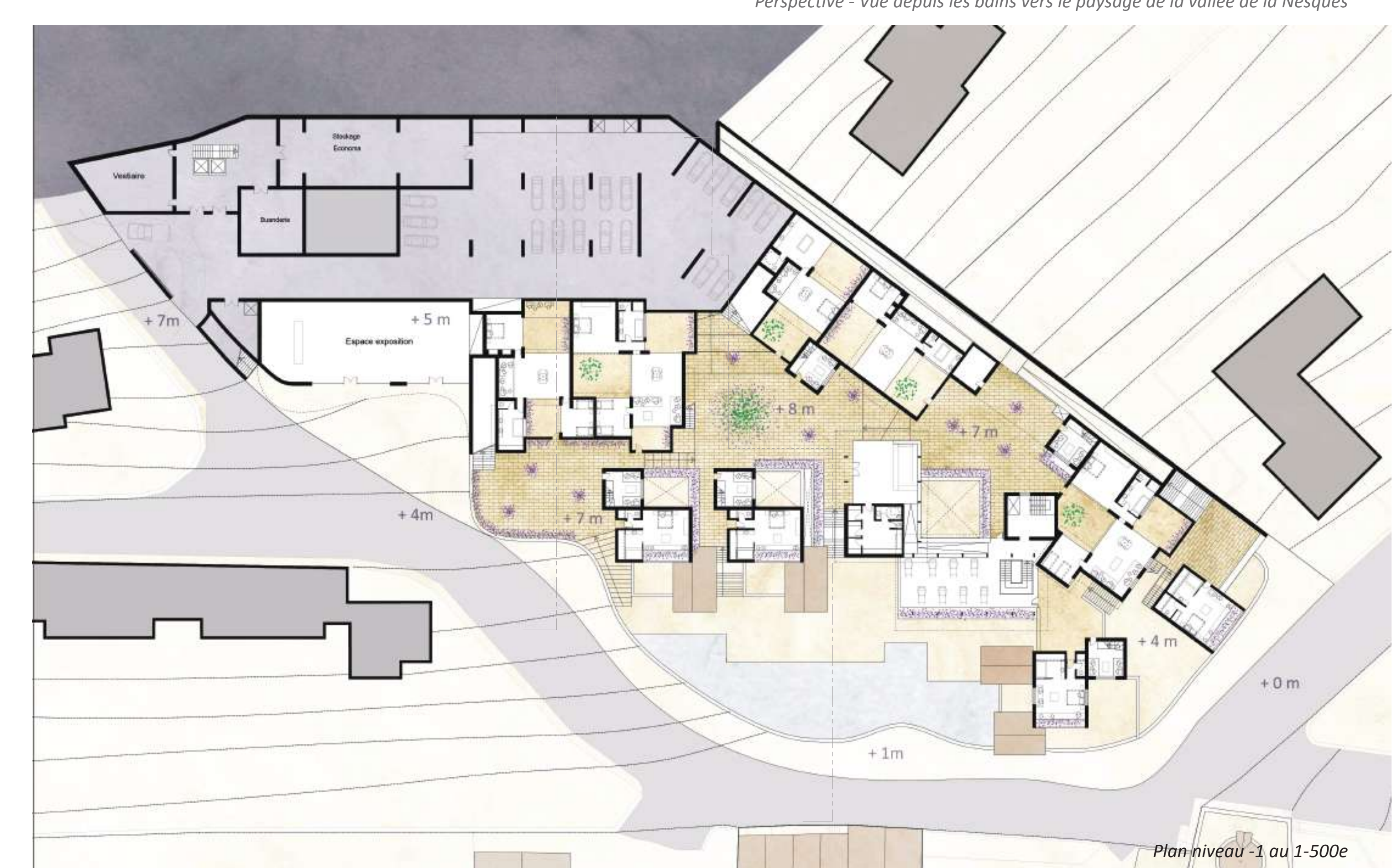
Plan niveau -1 au 1-500e

④ Point de vue et espace dégustation ⑤ Hall d'entrée ⑥ Restaurant ⑦ Entrée de l'espace Spa ③ Espace d'exposition ② Promenade - Jardin aromatique ① Boutique