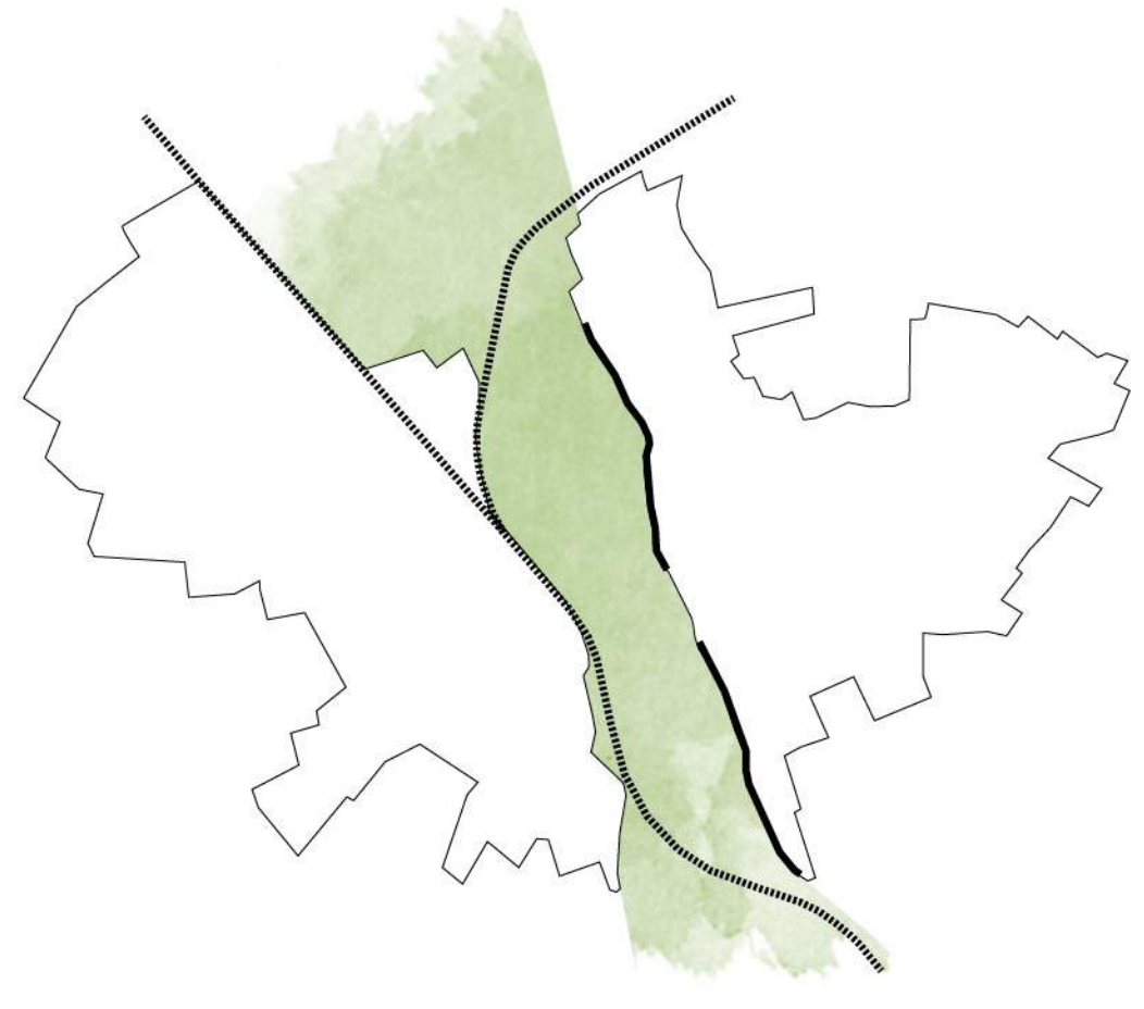
La vallée de l'Indre et les obstacles à sa pratique

Changer de regard sur le territoire naturel et agricole de Buzançais