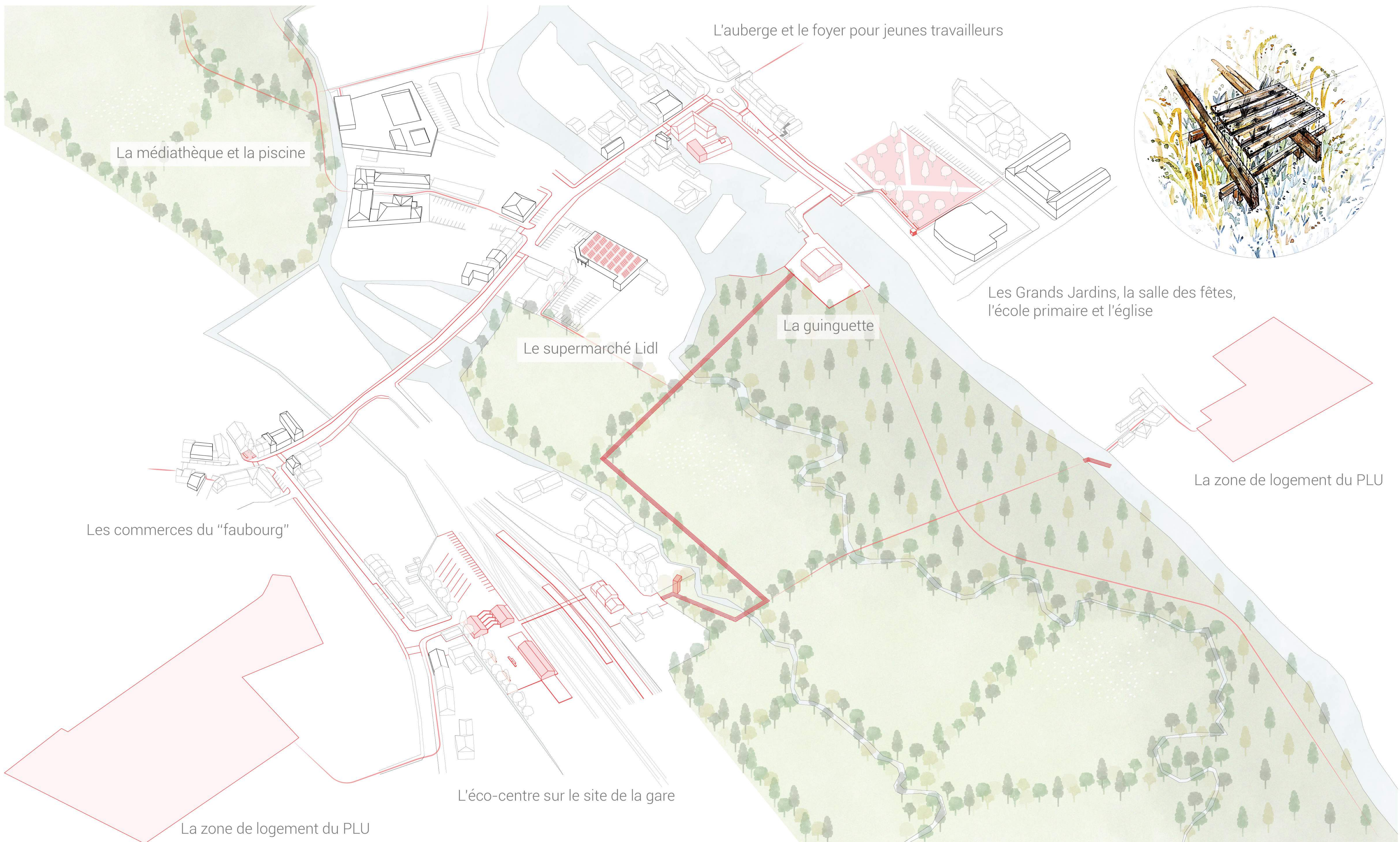
L'auberge et le foyer pour jeunes travailleurs