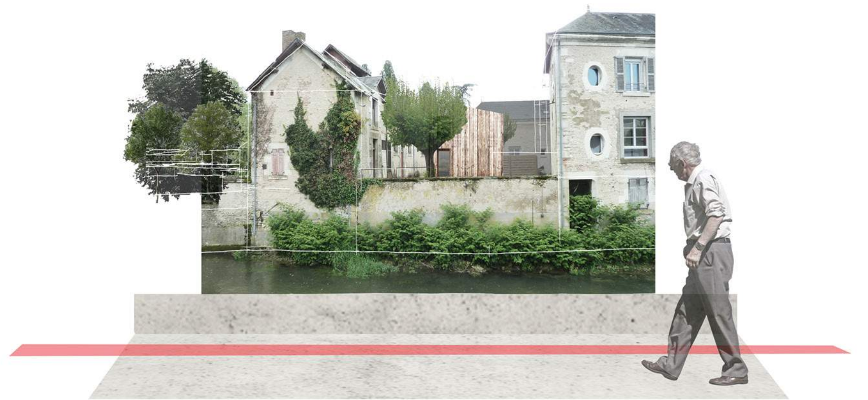
L'auberge et le foyer pour jeunes travailleurs