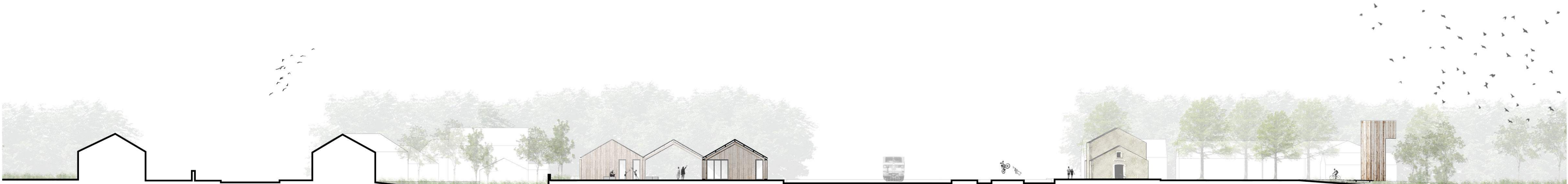
La gare - Mettre en valeur le patrimoine architectural local