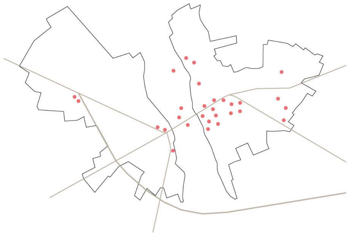
Une commune séparée en deux parties inégales