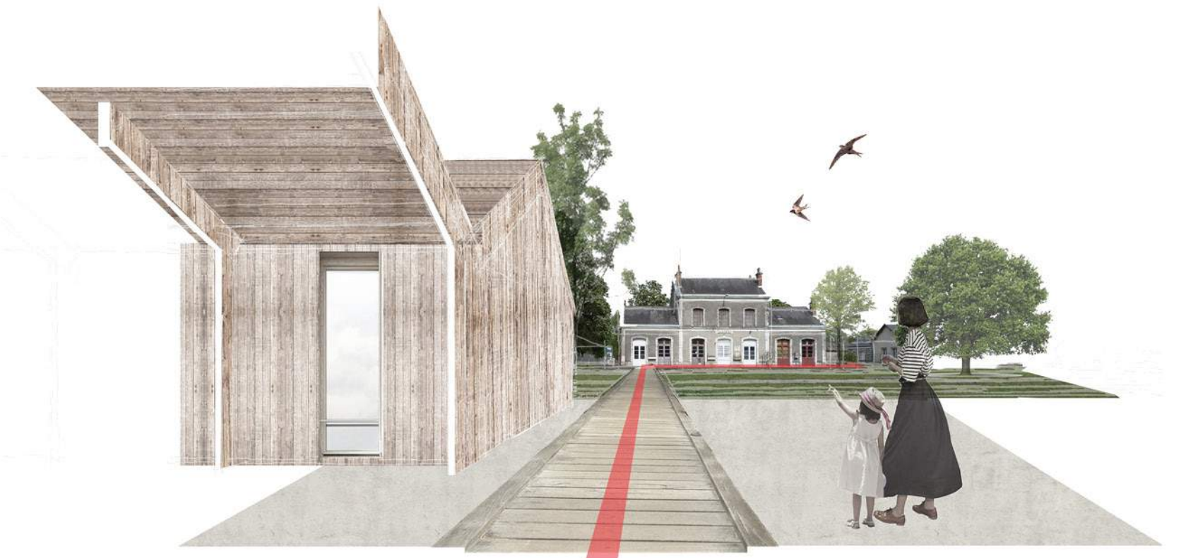
L'éco-centre et la gare