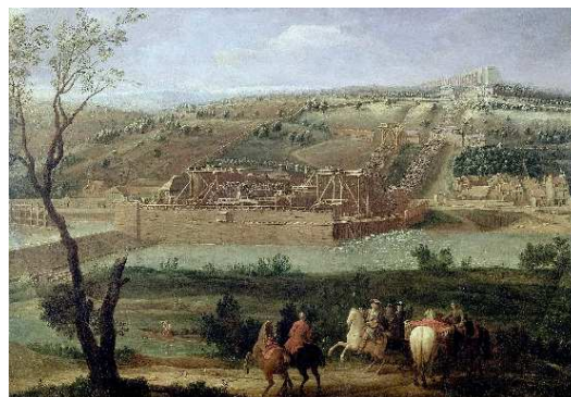
La Machine de Marly - Pierre-Denis Martin, 1723