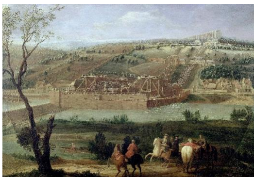
La Machine de Marly - Pierre-Denis Martin, 1723