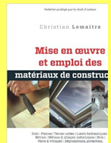
B16.80 LEMAITRE, Christian. Mise en œuvre et emploi des matériaux de construction. Eyrolles, 2012