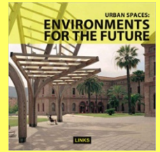
B16.80 KRAUEL, Jacobo. Urban spaces : environments for the future. Links, 2009